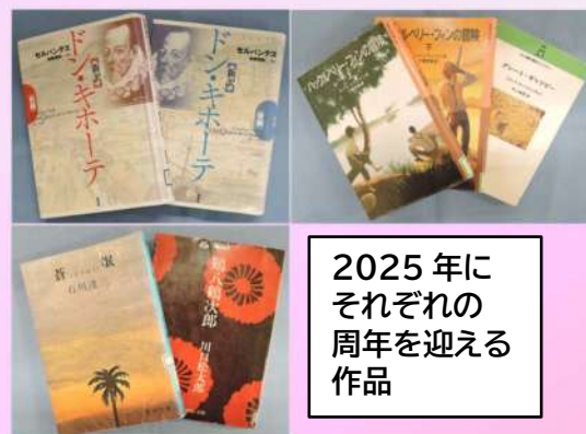
2025年にそれぞれの周年を迎える作品

「蒼氓」は、掲載予定だった雑誌の出版社が倒産し、文学同人誌に掲載されたのが受賞でした。そして今年は大規模同人誌頒布会のコミックマーケットの第1回開催から50周年です。この頒布会は漫画だけでなく、小説や評論、科学解説などの同人誌も頒布されています。