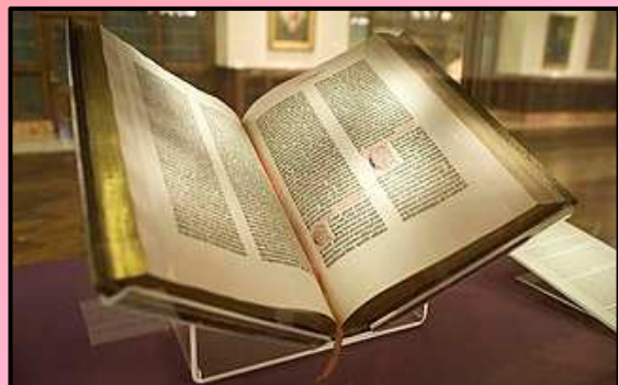
ニューヨーク公共図書館所蔵のグーテンベルク聖書

今年、『グーテンベルク聖書』が1455年に出版されて570周年です。この技術はヨーロッパで本が広がる基礎となりました。