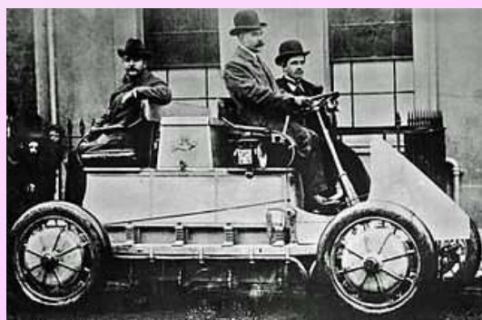
ローナー・ポルシェ, 1902年撮影 パブリックドメイン

科学技術分野ですと、20世紀の自動車産業に影響を与えた、フェルディナンド・ポルシェ、クライスラー社の創業者ウォルター・クライスラー、ゼネラル・モーターズ社を大きく成長させたアルフレッド・スローンの3人が1875年生まれで生誕150周年に当たります。